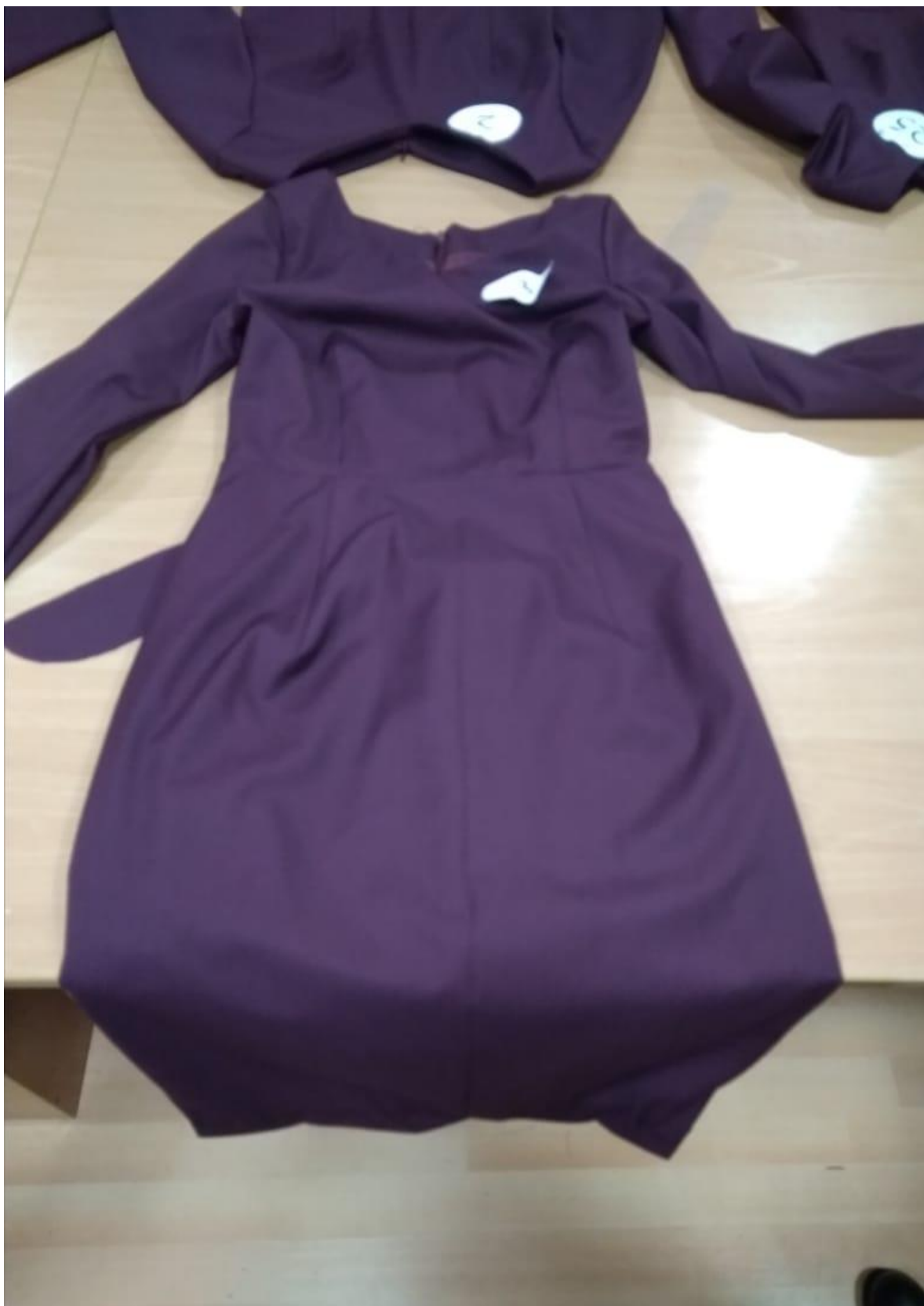
Әбдіразак Айару №3