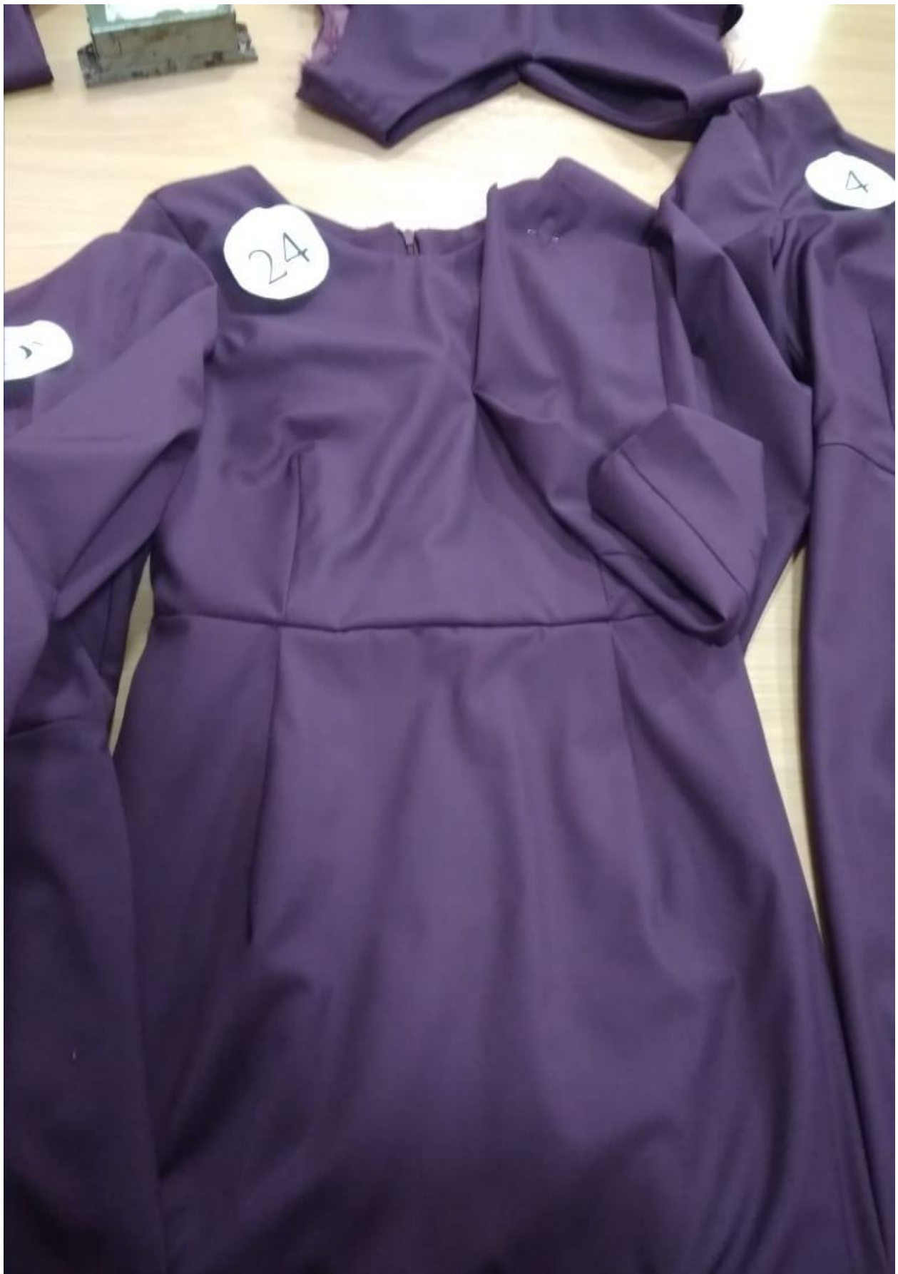
Саделхан Салтанат №24