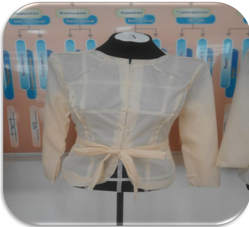
Әбдіразак Айару №3