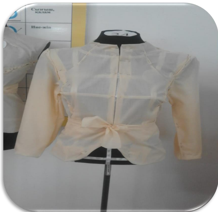
Саделхан Салтанат №24