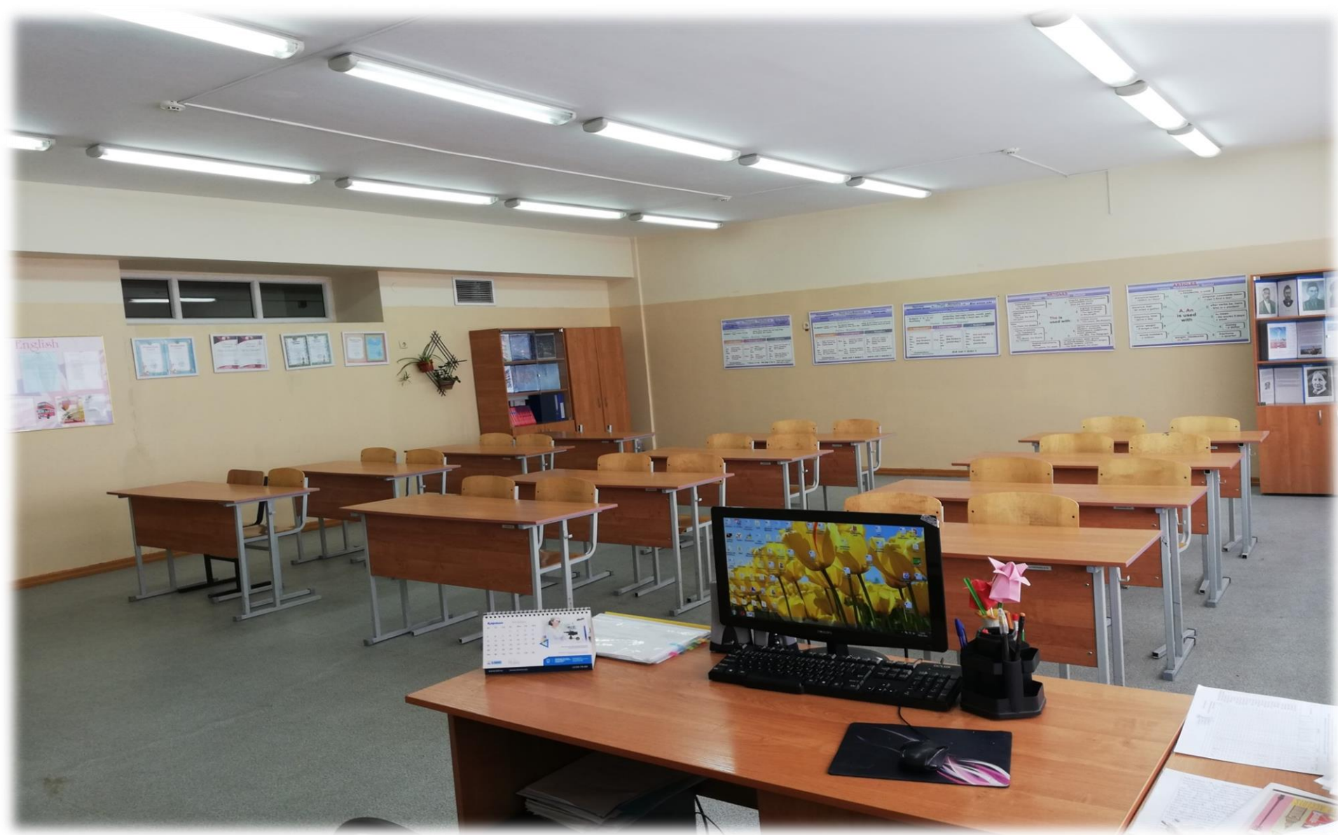
211 кабинет меңгерушісі Шәмеке Г.Н