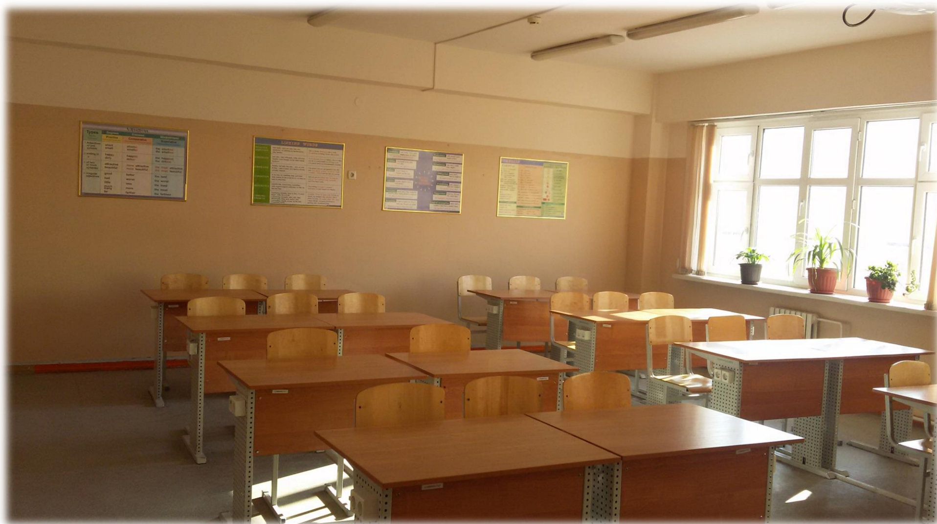
210 кабинет меңгерушісі Тұяқова А.Ж